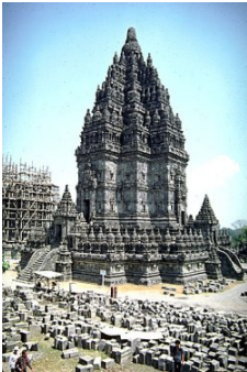
Prambanan (detalle de una torre)